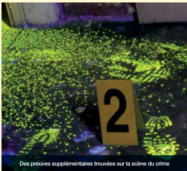
Des preuves supplémentaires trouvées sur la scène du crime

“JE PENSE QU'INTELLECTUELLEMENT, ÇA DOIT ETRE TRES DUR A VIVRE, TRES DUR A PORTER DE SAVOIR QU'ON PEUT SE PRENDRE UN COUP DE LAMPE N'IMPORTE OU, N'IMPORTE QUAND ET QUE CETTE LAMPE PEUT DIRE: VOUS AVEZ BRAQUE A TEL ENDROIT TELLE DATE.”