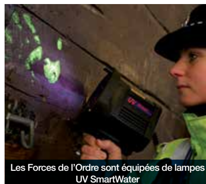
Les Forces de l'Ordre sont équipées de lampes UV SmartWater